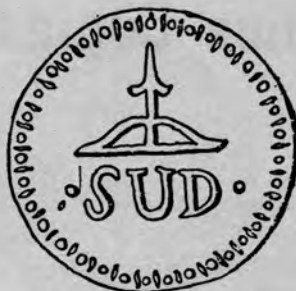
Fig. 5.—Cast silver 8 Reales. (Number 6394 sale on Fonrobert Collection). Philip The Second