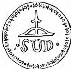
Fig. 5.—8 realer vaciada en plata (No. 6934 venta de la Colección Fonrobert).

Revisando literatura al respecto encontré que en el famoso folleto en el que el Dr. Nicolás León reproduce y amplía el estudio de Lyman H. Low de 1886, y que se intitula " La Moneda del General Insurgente Don José María Morelos ", publicado en Cuernavaca en