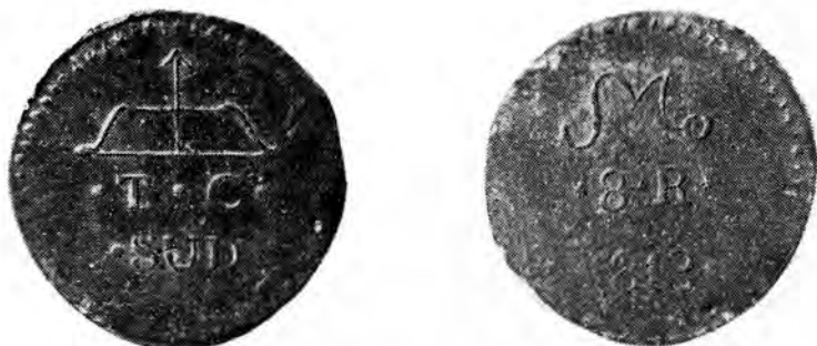
Fig. 2.—Variante de 8 Reales T. C. (Colección del autor)

muy diferente. En primer lugar todas las letras son del mismo estilo del tipo, pero obviamente más pequeñas, y están además formando grupos más compactos dejando así más áreas libres que en el tipo. El arco es también muy distinto: más fino, más abierto y con la flecha más larga. Pero la diferencia más radical la tenemos en la gráfila. En las monedas tipo esta es una serie alterna de asterisco y tildes horizontales, a veces bastante espaciados (El espaciamiento es algo variable, como se ve comparando ambos lados de la figura 1), que va colocada a cierta distancia