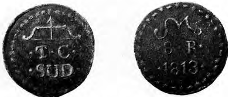
Fig. 1.— 8 Realet T C normal (Colección Escobar)

En la figura 1 puede verse una pieza de 8 R., *T*C*, que además de ser absolutamente típica tiene el interés de mostrar lo que es casi el límite extremo de variación esperable en esta moneda; una de las letras; la T del T.C., está muy inclinada hacia la izquierda. Casi todas las letras en ese lado están inclinadas igualmente, pero ninguna tanto como la T.