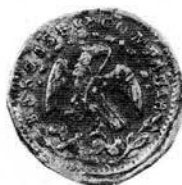
EMERGENCY COINAGE STRUCK AT VILLA DE LAGOS