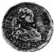
MONEDAS EMITIDAS EN LA VILLA DE LAGOS