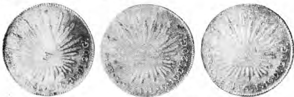
1850 ZG.C. (Fig. 2) en vez de Zs. O.M. — 1854 ZG.C. (Fig. 3) en vez de Zs. O.M. 1854 GG.J. (Fig. 4) en vez de Go. P.F. — 1881 MJ.H. (Fig. 5) en vez de Mo. M.H.

Las otras monedas parecen a simple vista piezas de 8 Reales de la República de las llamadas de "Resplandor"; pero al examinarlas con más cuidado se encontró que llevan las siglas siguientes: